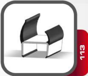
Mil (Boru) Yuvası Küçük - Galveniz Small Guide Plates - Galvanized