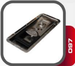
Gömme Kilit Krom