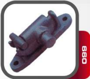
Döküm Kanca Paslanmaz