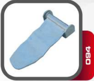
Kapalı Kasa Menteşesi 6 mm