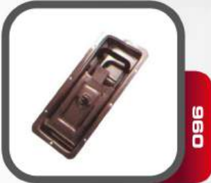
Gömme Kilit Yeni Model